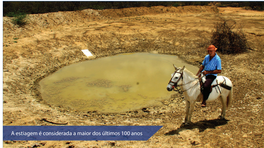
A estiagem é considerada a maior dos últimos 100 anos

O decreto é importante também para que o estado continue captando recursos do Governo Federal. Somente em 2017, já foram garantidos pelo Ministério da Integração Nacional, para continuidade da Operação Vertente, que fornece água potável à população através de carros-pipa, R$ 12,7 milhões. Também já estão assegurados para o Estado, via Ministério, R$ 88 milhões para a Adutora Afonso Bezerra - Pendências, e para a mudança de captação da Adutora de Jerônimo Rosado e Sertão Central Cabugi.