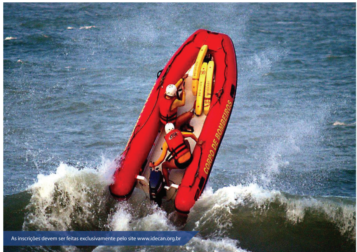
As inscrições devem ser feitas exclusivamente pelo site www.idecan.org.br

Ainda que o salário inicial seja de R$ 2.904,00, a remuneração pode chegar, nos termos da legislação pertinente às promoções referentes ao quadro de praças, ao valor de R$ 9.472,65, subsídio correspondente ao cargo de Subtenente Nível X. O concurso público terá validade de dois anos, podendo ser prorrogado por igual período.