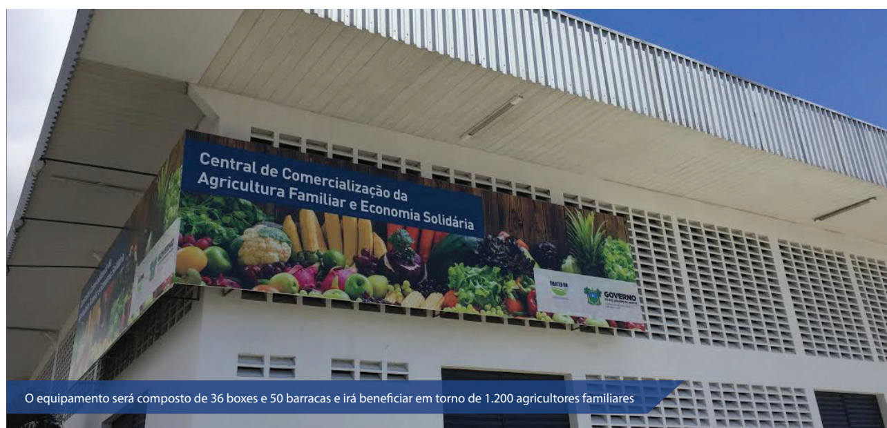
O equipamento será composto de 36 boxes e 50 barracas e irá beneficiar em torno de 1.200 agricultores familiares

A reforma e recuperação da estrutura da Central foi orçada em R$ 705 mil