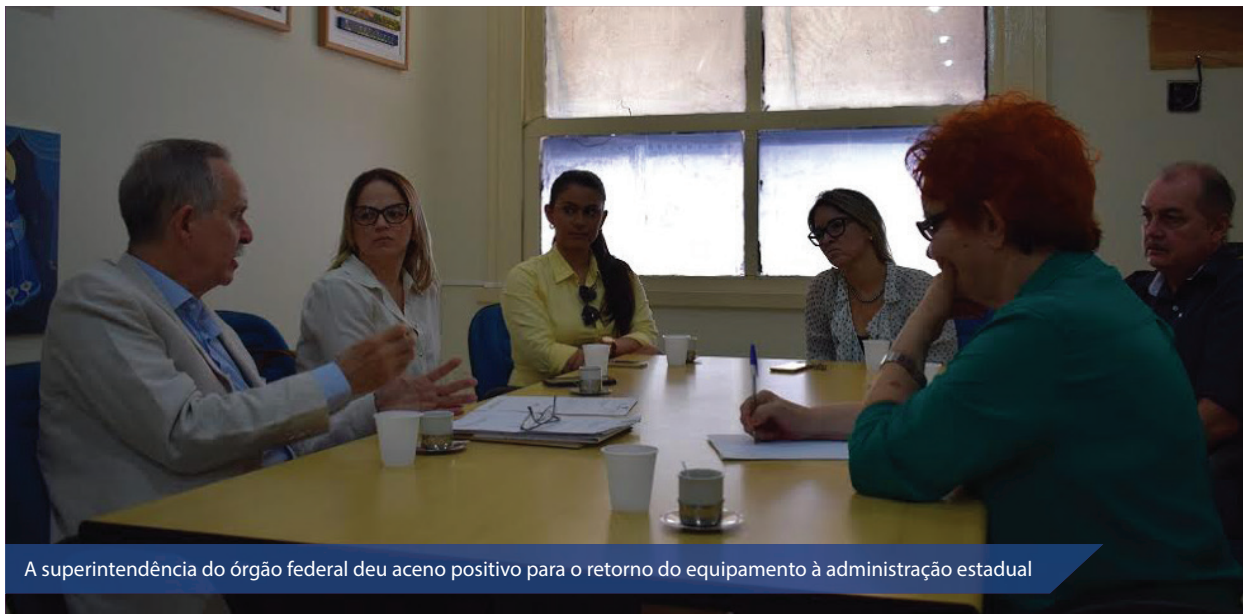
A superintendência do órgão federal deu aceno positivo para o retorno do equipamento à administração estadual